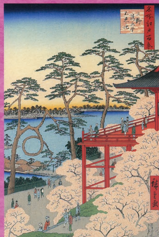
歌川広重画「名所江戸百景 上野清水堂不忍ノ池」